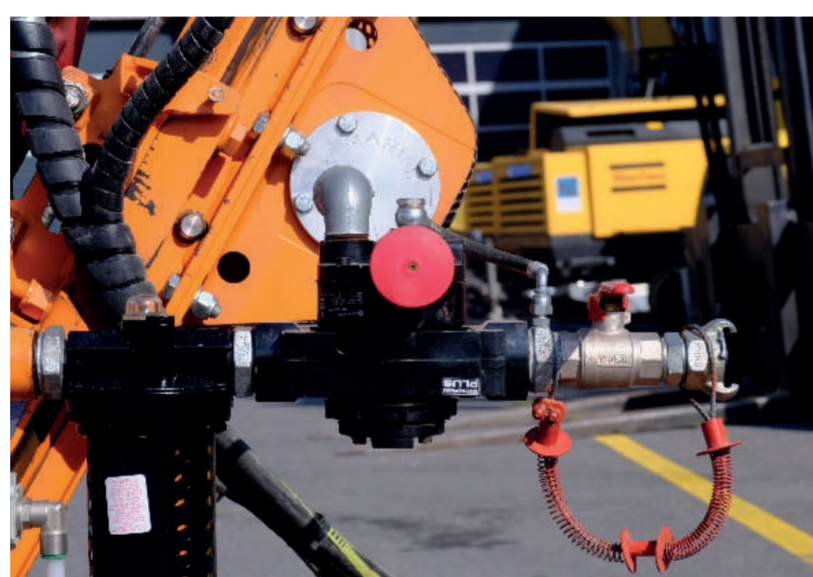
Groupe Commandes avec bouton arrêt d'urgence