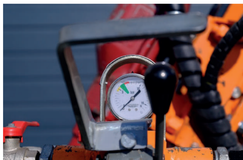
Protection des commandes